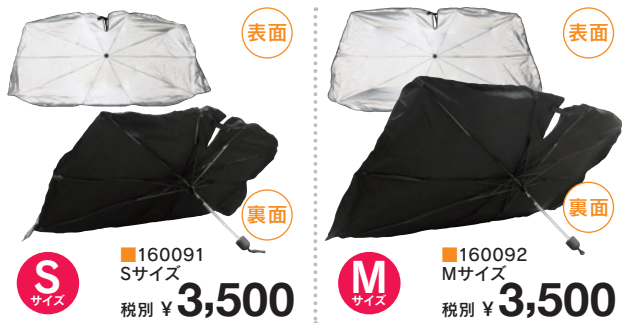
表 面: チタンコーティング 裏 面: 190Tポリエステル シャフト: スチール グリップ: ポリプロピレンプラスチック