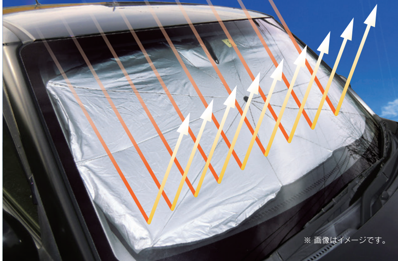
※ 画像はイメージです。